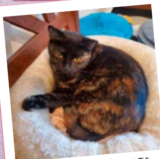
MINUSCH · 7 MONATE