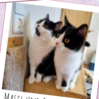
MASEL UND RITA · 1 JAHR