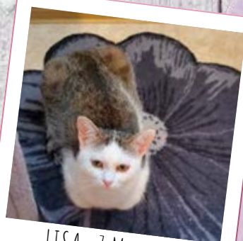
LISA · 7 MONATE