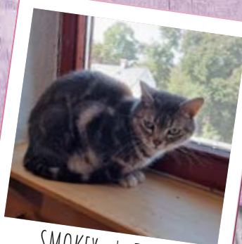
SMOKEY · 4 JAHRE