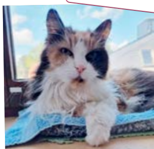
MINKA · 10 JAHRE