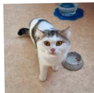
ASLAN · 1,5 JAHRE