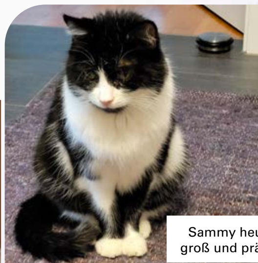
Sammy heute – groß und prächtig