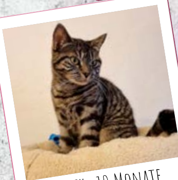
FLUFFY · 10 MONATE