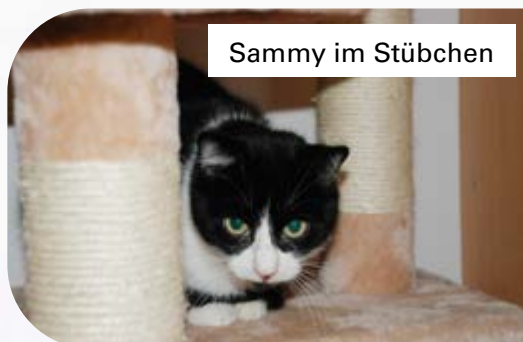
Sammy im Stübchen

Und schauen Sie sich unseren Sammy jetzt an, wie groß und prächtig er geworden ist, mit schönem glänzendem Fell und ohne wundgeleckter Nase. Das ist unsere Weihnachtsgeschichte für Sie!!