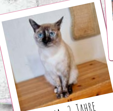
LUNA · 2 JAHRE